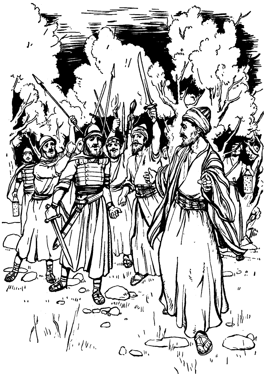
Judas Iscariote ki koos ngérög.