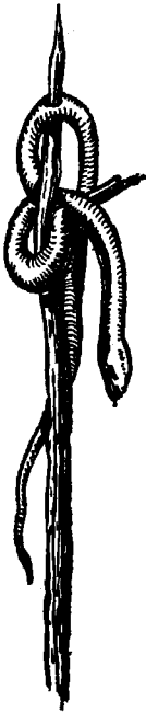
Li ki ga dö kagt.

14 Tit in haṅ Moïse un'n li kidoṅ kam kort yé, titbè tò kari na a unin nè Ngwon-dé kidoṅ ho yé; 15 kitökad dé kirei'n ndi ada rota a nè ndi'n ki kumkajir kimbaṅ kinöt. 16 Kitö Luḅah tar dég ki döningt nè, mbaṅ ad Ngwon'n kikal kirabè, kitökad dé kirei'n ndi ada rota a nè, ki nuj kö al, na ki ndi ki kumkajir kimbaṅ kinönt. 17 Kitö Luḅah la Ngwon'n ki döningt kad ki n'gang'n ta dö dégt ki döningt nè al, na kad dég ki döningt nè ajin kitakula.