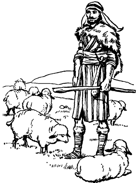
Ngéngonmbatg ki batg lon.

22 I dönah kult, i kaglo ra fête ki töa i *Fête Kar kuj ndub Luḅah kam bébo Jérusalem. 23 Jésus a ndia kam kuj ndub Luḅah, gir bulot lo Salomon, 24 Kitö inñen Juifg lan'na gugin döa, ndijèna annan: «Mbañ ki ndö ri a i nyaji ki kam ki ra bississ a? Inla i Christ a nè, el i jaji rau!» 25 Jésus turdi an: «M'elsi woi, na adin rota al. Killäg ki m'ndi m'ra kam tö Bobmt inñ la ndi mammin naj yé. 26 Na adin rota