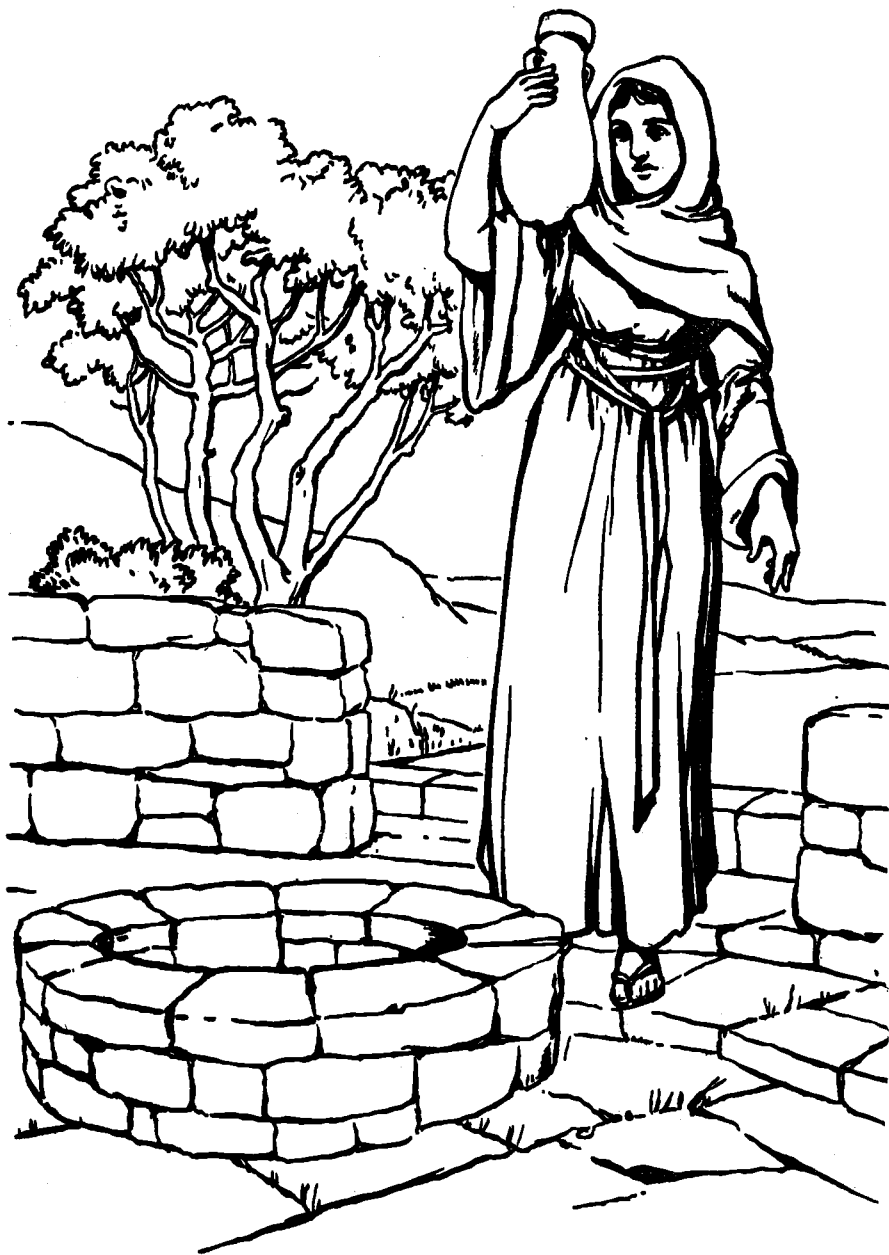
Dékiden ki Samarie ré kod man.